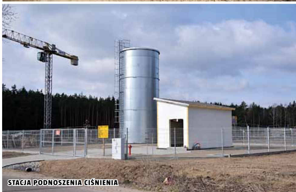
STACJA PODNOSZENIA CIŚNIENIA