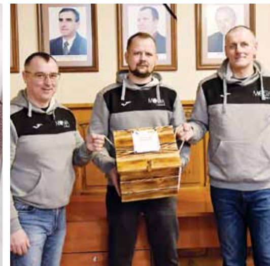
Miejski Ośrodek Sportu i Rekreacji