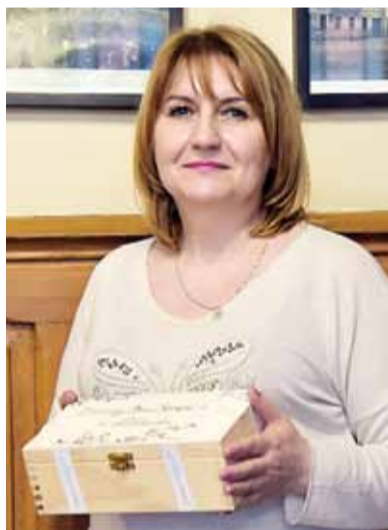
Dzienny Dom Senior +