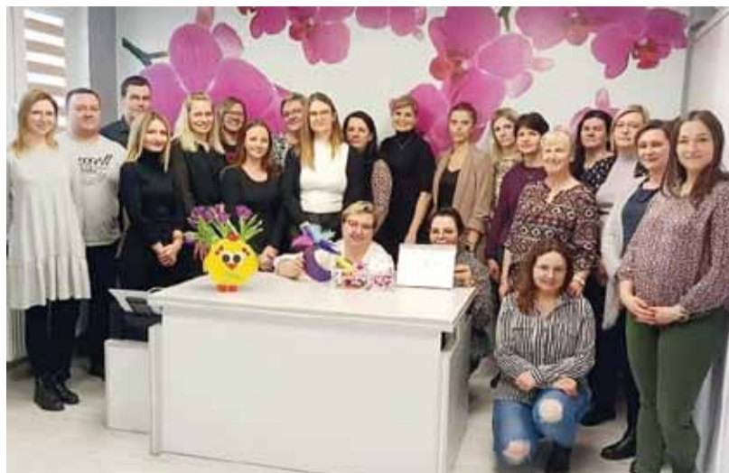
Miejski Ośrodek Pomocy Społecznej