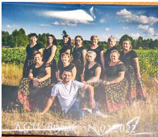
Koło Gospodyń Wiejskich w Brynku