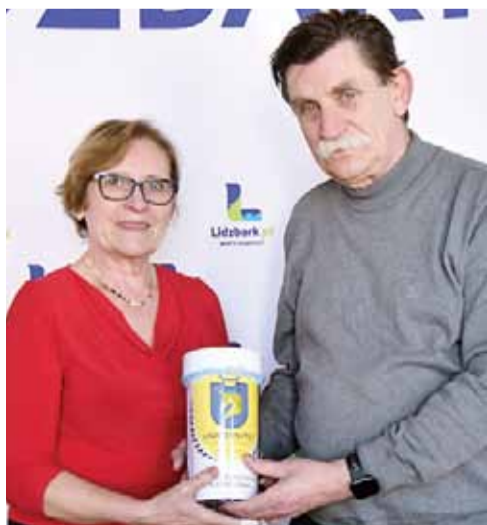
Uniwersytet Trzeciego Wieku