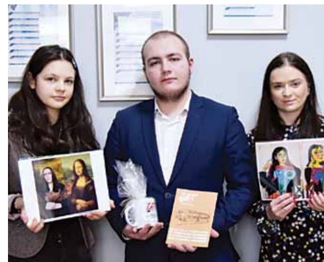
Zespół Szkół w Lidzbarku