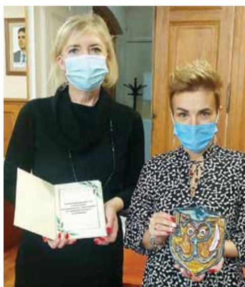
Szkoła Podstawowa nr 2