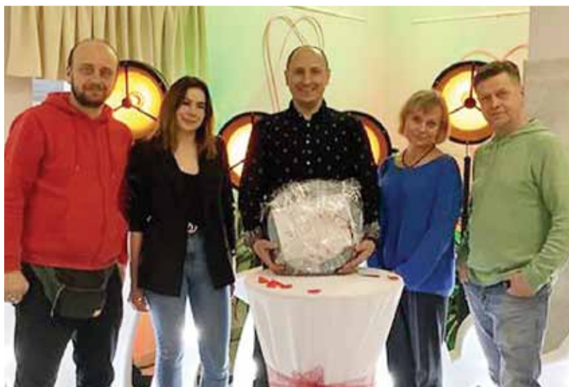
Miejsko - Gminny Ośrodek Kultury