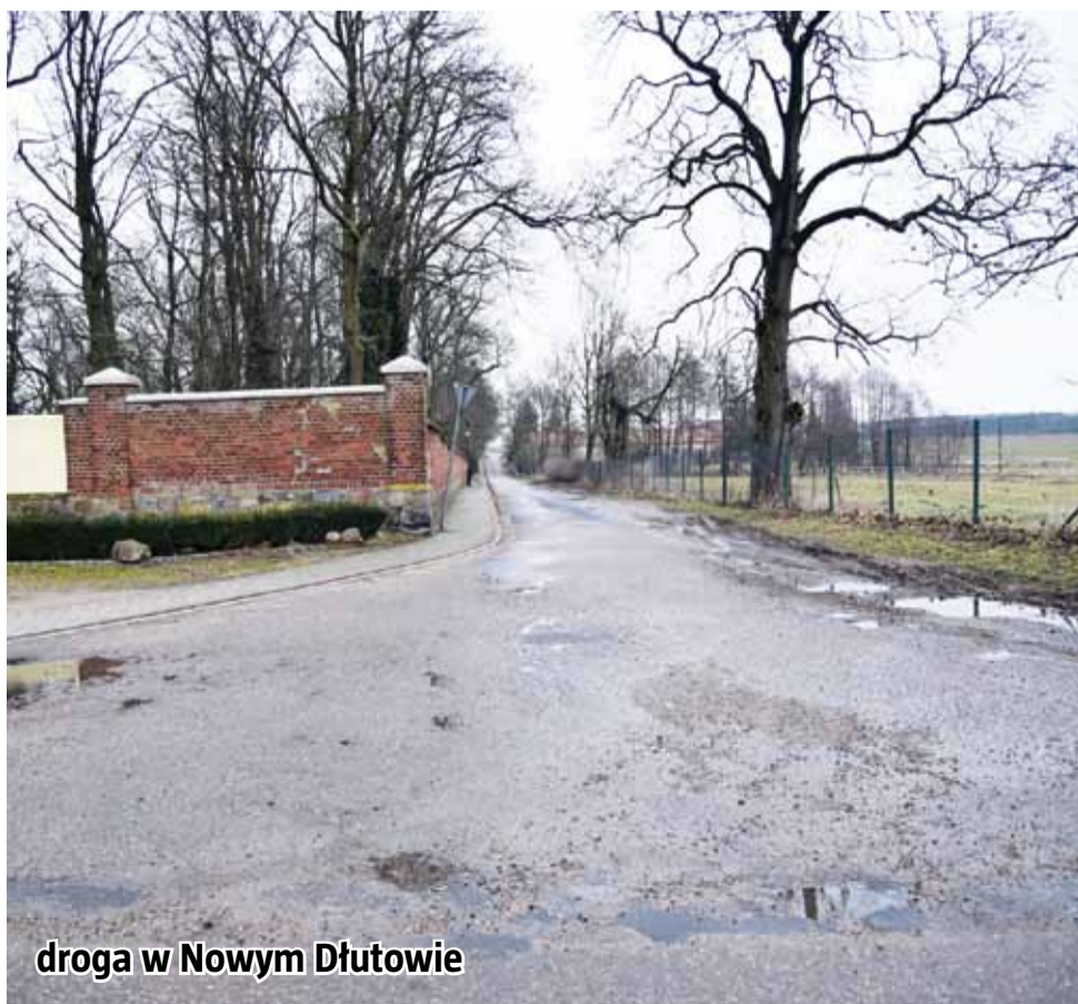
droga w Nowym Dłutowie