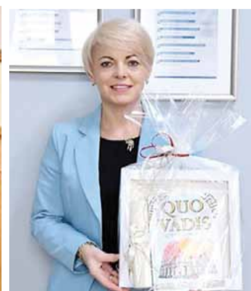
Szkoła Podstawowa w Dłutowie