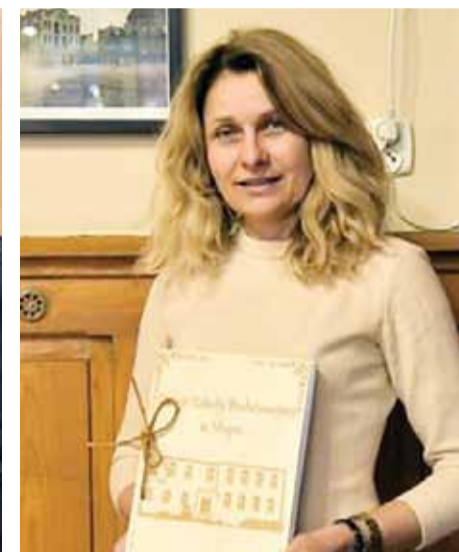
Szkoła Podstawowa w Stupie