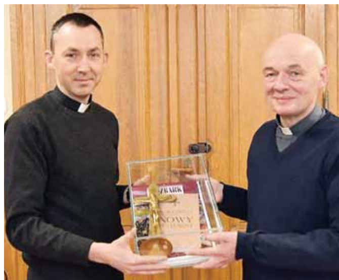
Parafia pw. św. Wojciecha