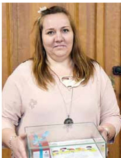
Przedszkole we Wlewsku