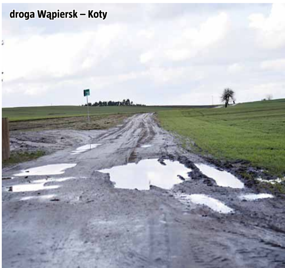
droga Wąpiersk – Koty