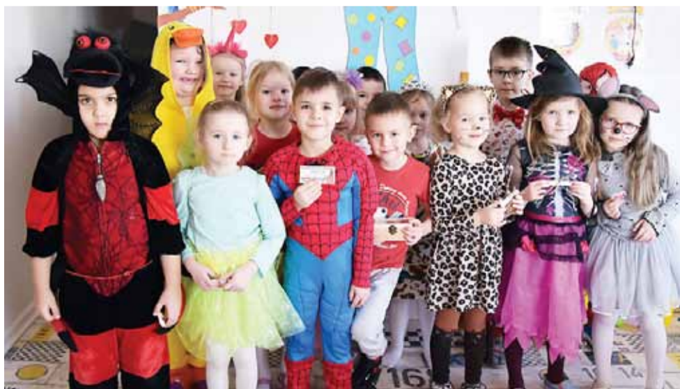
Przedszkole Bajkowy Zakątek