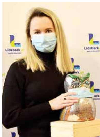
Środowiskowy Dom Samopomocy