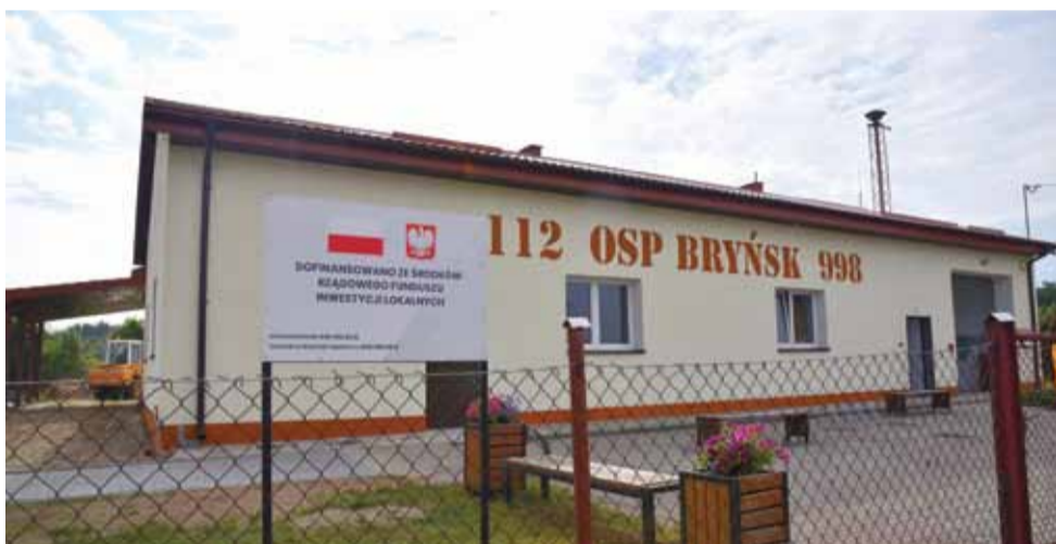
Świetlica w Bryńsku