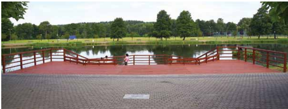
Wyremontowane pomosty na lidzbarskiej promenadzie

zł. Dzięki pozyskanym środkom świetlica w Wawrowie zostanie przebudowana i wyremontowana. W budynku zostaną wykonane prace remontowo-budowlane pozwalające dostosować świetlicę do potrzeb seniorów i osób niepełnosprawnych. Przy pomocy uzyskanej dotacji zostaną zlikwidowane bariery architektoniczne, a pomieszczenia zostaną wyposażone w urządzenia dla osób niepełnosprawnych. Wyremontowane zostanie m. in. pomieszczenie ogólnodostępne pełniące funkcję sali spotkań oraz aneks kuchenny do przyjmowania i wydawania posiłków, łazienki. Wydzielone zostanie także miejsce pełniące funkcję szatni. Klub Seniora w miejscowości