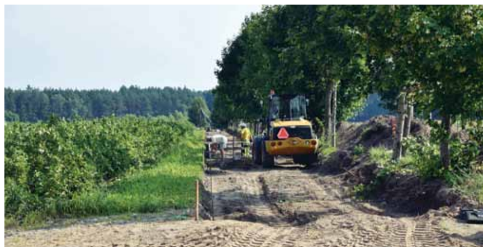
Budowa chodnika w kierunku Jelenia