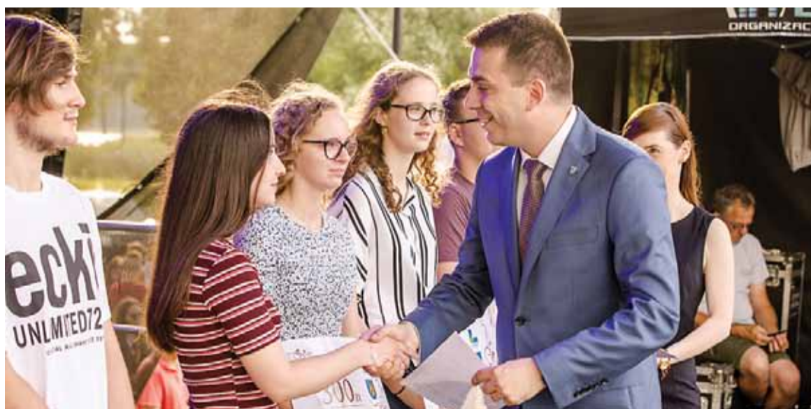
Wręczenie nagród – Dni Lidzbarka 2019

W roku szkolnym 2019/2020 Burmistrz Lidzbarka przyznał nagrody 121 uczniom o łącznej kwocie 39 500,00 zł. Ze względu na panującą sytuację wyróżnienia przekazane zostały a ręce dyrektorów szkół, którzy przekazali je swoim wyróżnionym uczniom. Nagrody trafiły do uczniów każdej ze szkół z terenu naszej Gminy. Warto zaznaczyć, że liczba uczniów nagradzanych za swoje osiągnięcia sukcesywnie z roku na rok stale