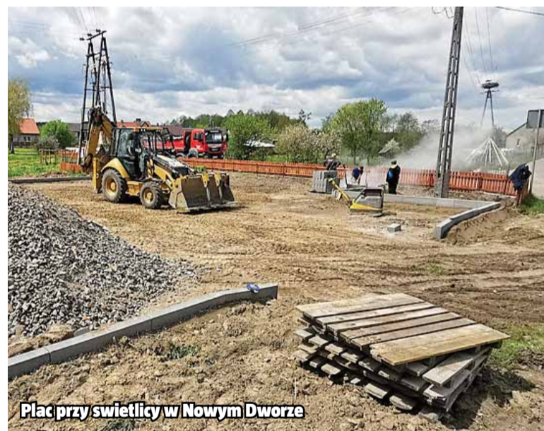
Plac przy świetlicy w Nowym Dworze