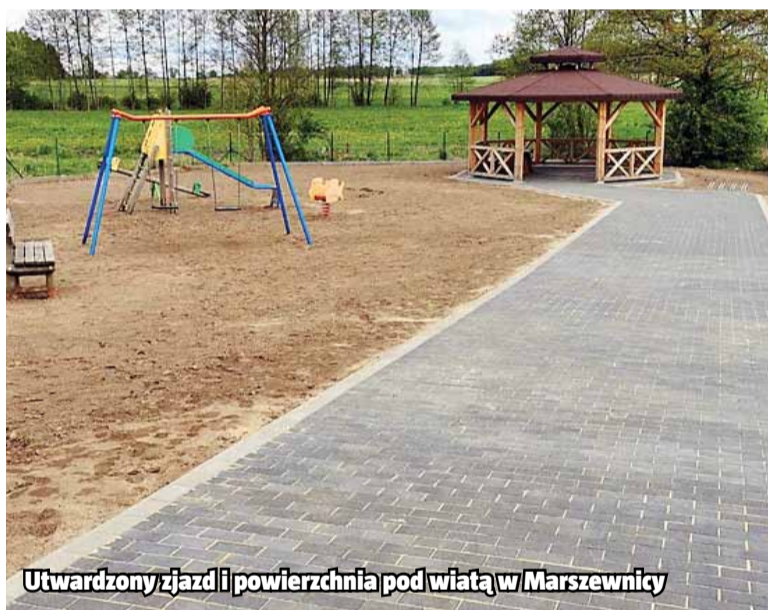
Utwardzony zjazd i powierzchnia pod wiatą w Marszewnicy