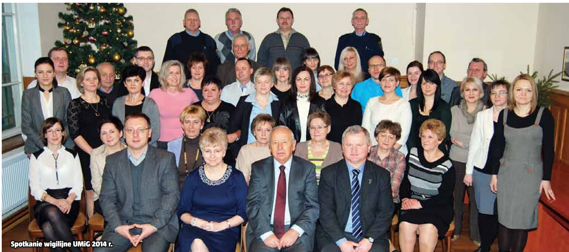
Spotkanie wigilijne UMIG 2014 r.