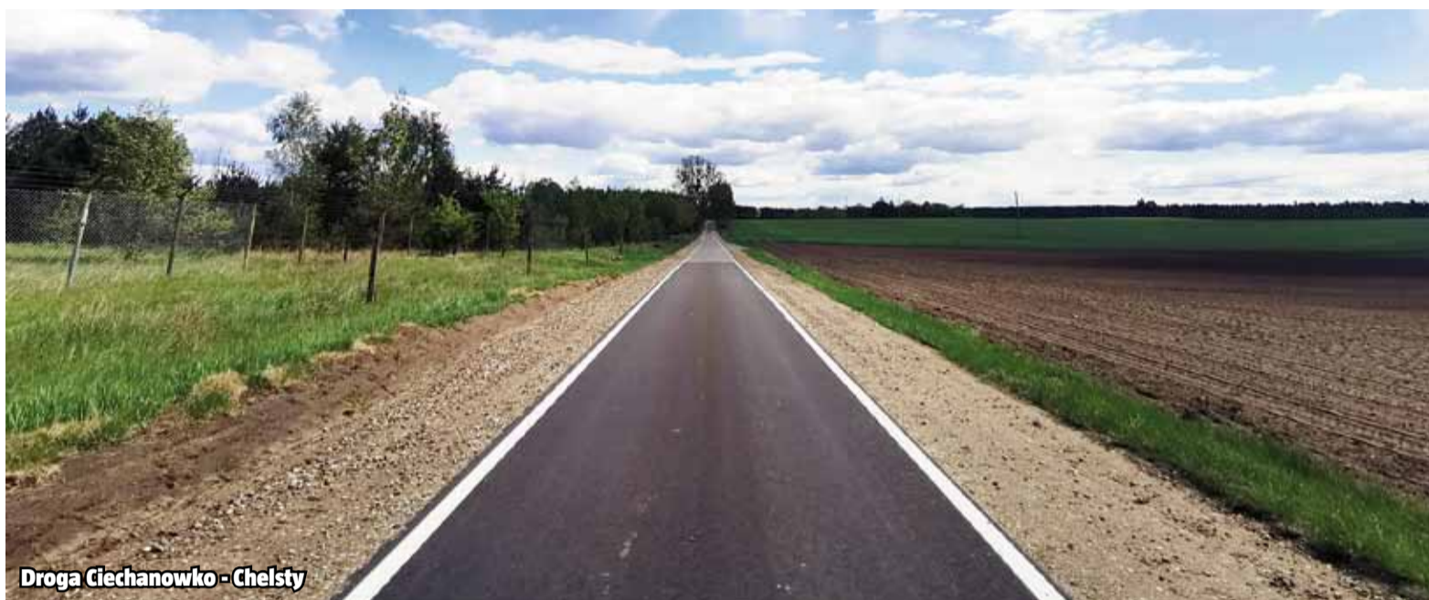
Droga Ciechanówko - Chełst

W najbliższym czasie rozpocznie się przebudowa chodników przy ul. Marii Dąbrowskiej / Tuwima oraz budowa budynku świetlicy wiejskiej w Chełstach.