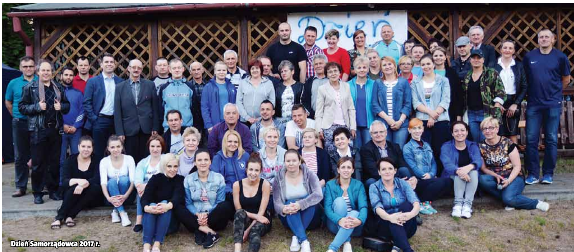
Dzień Samorządowca 2017 r.

Źródło: Michał Dzimira, Historia Lidzbarka 1301-2011. Tajemnice i ciekawostki, Lidzbark 2012 Edward Klemens, 700-lecie Lidzbarka Welskiego. Księga Pamiątkowa 1301-2001. Ważniejsze wydarzenia z dziejów miasta i okolic, Iława 2001 Kroniki Miasta i Gminy Lidzbark Archiwum UMIG