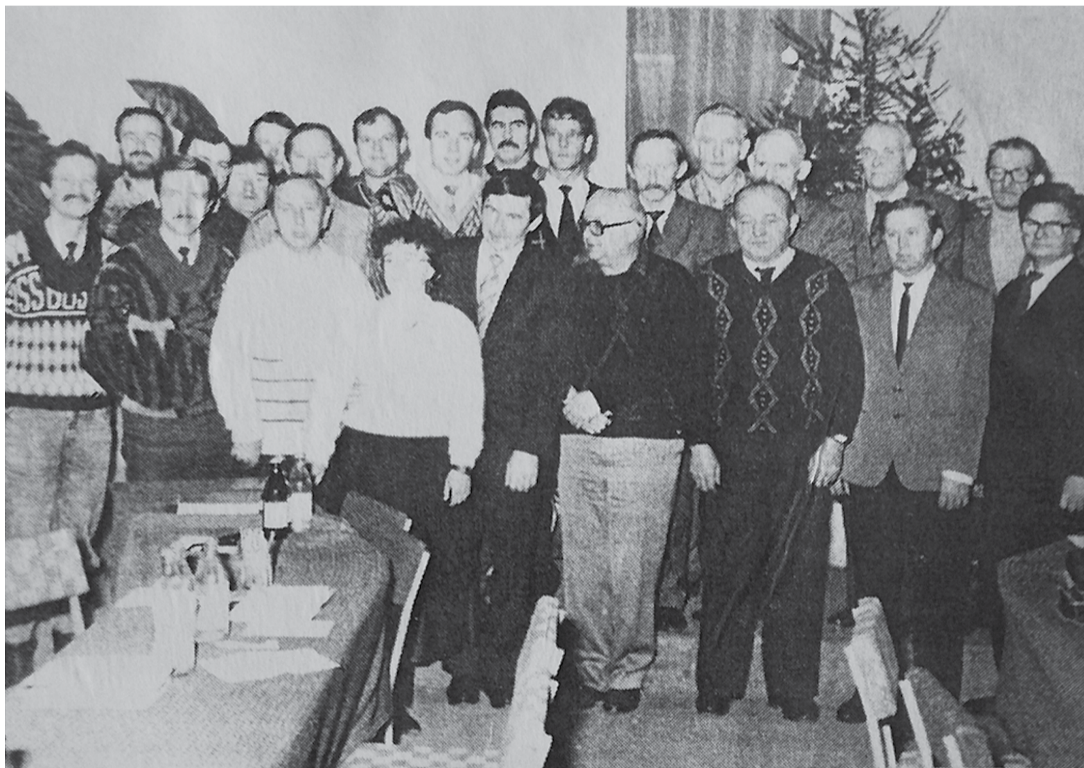
Rada Miasta i Gminy w 1990 r. (skład Rady patrz str. 8)

W tym roku obchodzimy 30-lecie samorządu w Polsce. To niezmiernie ważny i intensywny okres dla polskich samorządów. 30 lat temu odbyły się pierwsze wybory do rad gmin, a 8 marca 1990 uchwalono ustawę o samorządzie terytorialnym, która w życie weszła 26 maja 1990 r. Samorząd terytorialny pozwolił zdecentralizować zarządzanie krajem, oddając głos obywatelom. To oni najmocniej angażują się w przedsięwzięcia, które dotyczą ich bezpośrednio i na które mają realny wpływ. Powierzenie poszczególnych zadań wspólnotom dało możliwość decydowania i współtworzenia najbliższego otoczenia. To właśnie wtedy rozpoczął się czas wielkich inwestycji – budowy dróg, szpitali, szkół, sieci kanalizacyjnych i wodociągowych, boisk czy hal sportowych. A co za tym idzie poprawy warunków i jakości życia mieszkańców.