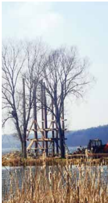
Wieża widokowa w Tarczynach.

Budowa ścieżki przyrodniczej wraz z wieżą obserwacyjną nad jeziorem Lidzbarskim to inwestycja Welskiego Parku Krajobrazowego. Wieża została sfinansowana z RPO Warmia Mazury na lata 2014-2020 przy wsparciu finansowym Gminy Lidzbark, której wkład w inwestycję wynosi 100 tys. zł. - Wieża powstanie na aktywnym stożku delty tzw. „kutlu” powstającym przy wpływie rzeki Wel do jeziora Lidzbarskiego – informuje Żaneta Głowacka, specjalista ds. ochrony przyrody i krajobrazu w Welskim Parku Krajobrazowym. Już pod koniec kwietnia, z około 8-metrowej wieży, będzie można podziwiać piękny widok na jezioro. To miejsce niezwykle atrakcyjne przyrodniczo. Prace nad jej budową idą pełną parą. – Cypel powstał w wyniku nanoszenia materiału przez rzekę Wel, więc konieczne okazało się wykonanie palowania. Obecnie wykonywane są 12 metrowe mikropale, które będą utrzymywały konstrukcję wieży – tłumaczy pani Żaneta. Jezioro będzie można obserwować z podestu położonego na 8 metrach. Podobna wieża stoi już m. in. nad jeziorem Tarczyńskim. Konstrukcja wieży jest dopasowana do pozostałej in-