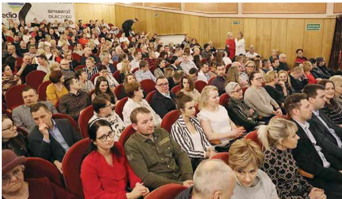
Spektakl obejrzało ponad 400 osób

Już dziś zapraszamy na występ kabaretu Paraniormalni, który odbędzie się 25 kwietnia w lidzbarskim Domu Kultury o godz.16:00. Bilety w kwocie 70 zł dostępne na kupbilecik.pl lub pod numerem telefonu 510 138 588.