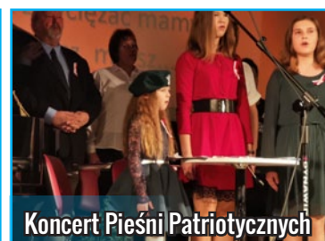
Koncert Pieśni Patriotycznych