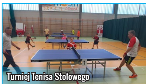
Turniej Tenisa Stołowego