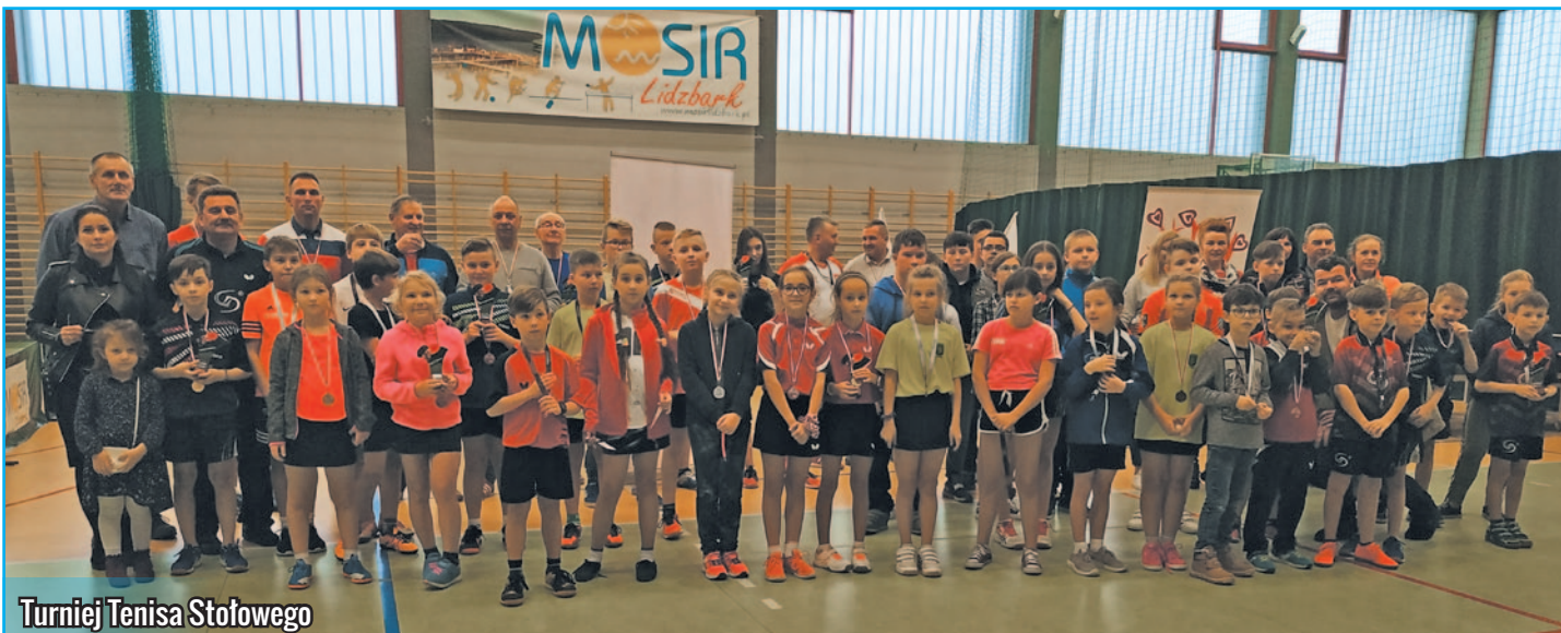
Turniej Tenisa Stołowego