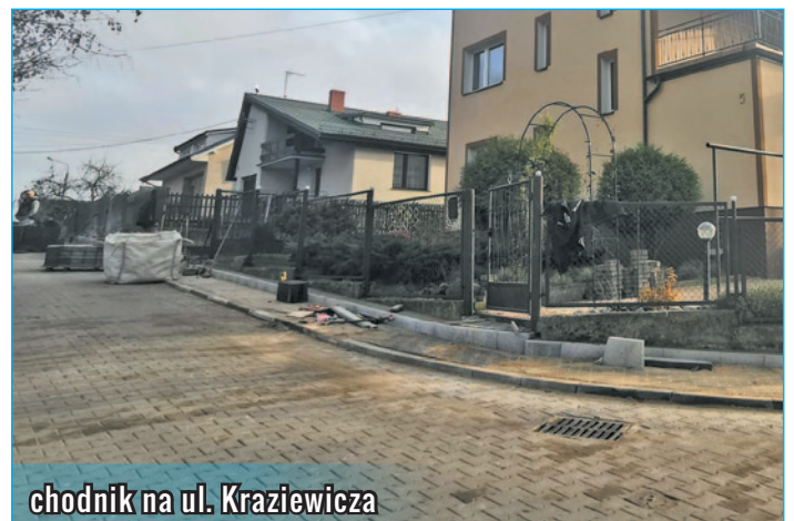
chodnik na ul. Kraziewiczza

Miejski Ośrodek Pomocy Społecznej w Lidzbarku w ramach Ogólnopolskiej Kampanii „Biała Wstążka” otwiera swe drzwi 7 grudnia 2019 roku w godzinach od 10:00–12:00. W tych godzinach zaprasza wszystkich szukających pomocy i wsparcia na bezpłatne porady i konsultacje specjalistów – członków Miejskiego Zespołu Interdyscyplinarnego do spraw Przeciwdziałania Przemocy w Rodzinie, do których należą: członek Gminnej Komisji Rozwiązywania Problemów Alkoholowych, Przewodnicząca Miejskiego Zespołu Interdyscyplinarnego, pracownik socjalny, policjant, pedagog szkolny, terapeutka.