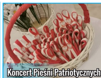
Koncert Pieśni Patriotycznych