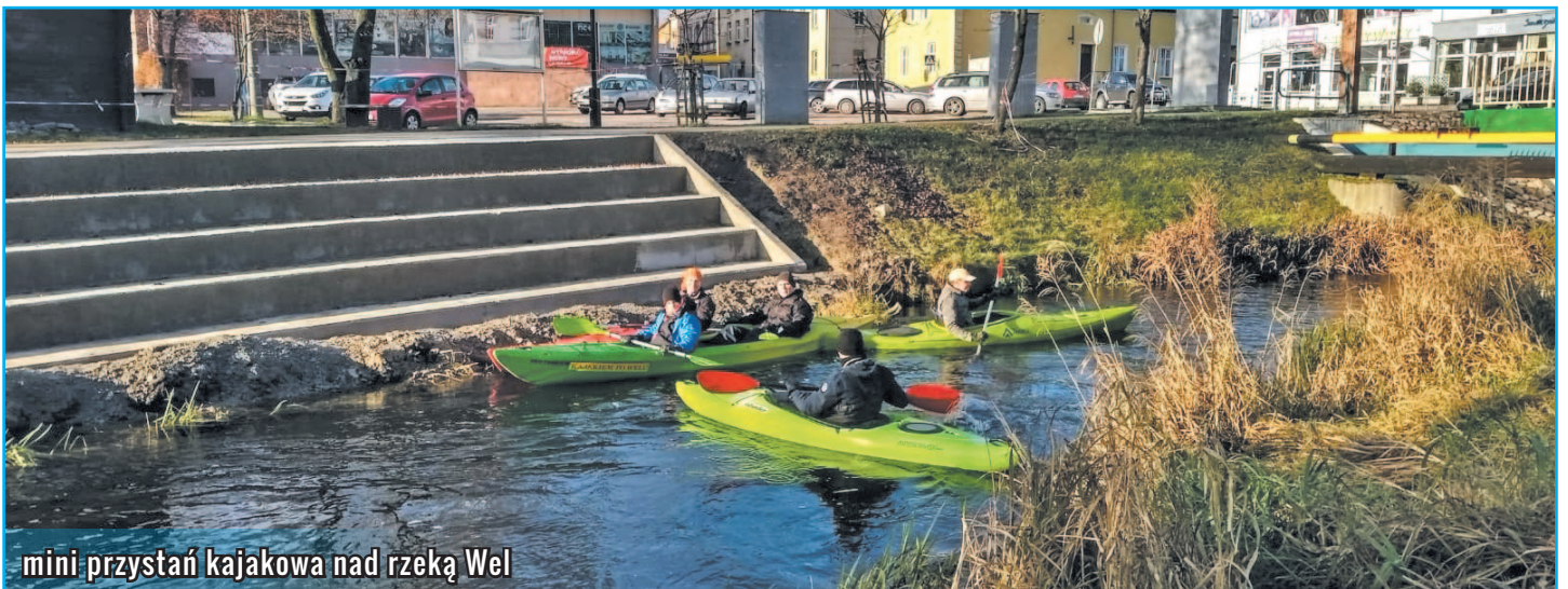
mini przystań kajakowa nad rzeką Wel

– Dzięki inwestycjom uczniowie w trakcie przerw będą mogli na świeżym powietrzu dbać o swoją aktywność