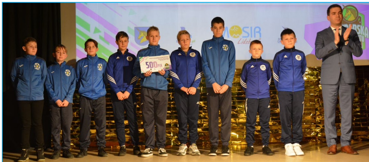
Drużyna UPKS Poncio 2010