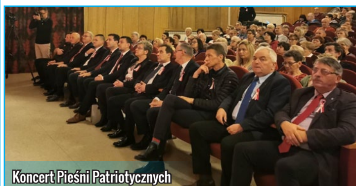
Koncert Pieśni Patriotycznych