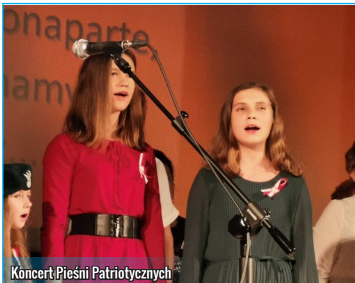
Koncert Pieśni Patriotycznych