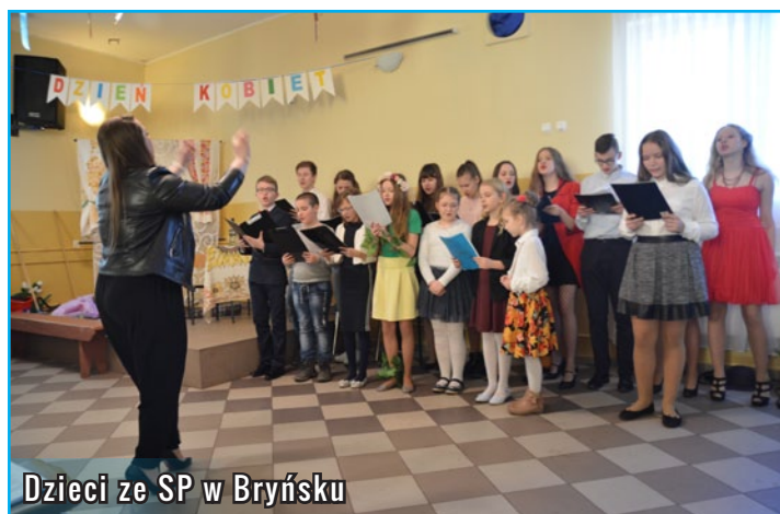
Dzieci ze SP w Bryńsku