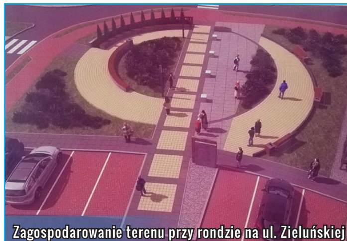
Zagospodarowanie terenu przy rondzie na ul. Zieluńskiej