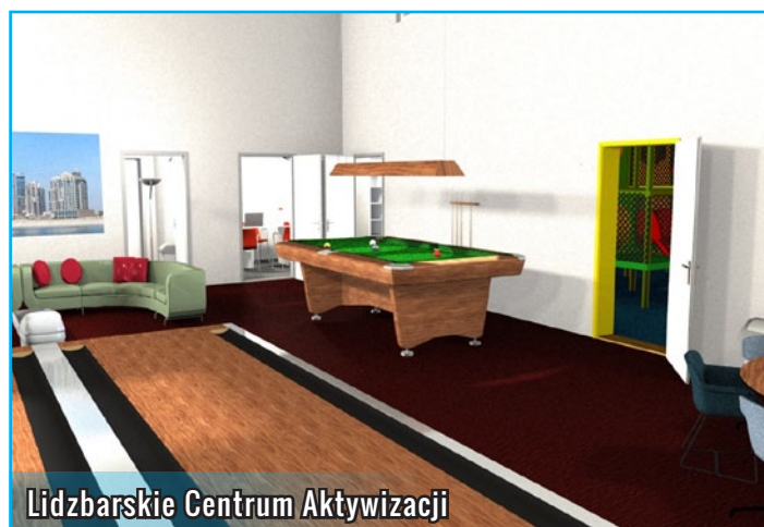
Lidzbarskie Centrum Aktywizacji