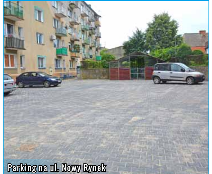
Parking na ul. Nowy Rynek

Zakończyły się prace przy przebudowie parkingu i drogi wjazdowej przy ul. Nowy Rynek, którą wykonało PGK. Koszt inwestycji to 87 822 zł. W trakcie są również prace przy budowie chodnika i parkingu przy świetlicy w Klonowie za 119 900 zł, którą wykonuje firma KAMEX oraz prace przy termomodernizacji szkół podstawowych w Słupie i Kiełpinach. SP Kiełpiny doczekało się już ocieplenia budynku i dachu. Otrzymało też nową elewację. Trwają prace związane z wymianą pieca, grzejników oraz oświetlenia. W SP Słup ocieplenie budynku z zewnątrz. W połowie lipca otwarto nowowyremontowany most na ul. Działdowskiej. Wspólna inwestycja miasta i Zarządu Dróg Wojewódzkich w Olsztynie. Opóźnienie w wyznaczeniu terminu odbioru końcowego spowodowane było przedłużającą się procedurą uzyskania pozwolenia na użytkowanie. Trwają prace przy budowie drogi i chodnika w Ciborzu za 119 875,80 zł. Rozpoczęła się przebudowa chodnika na ul. Młyńskiej i Cichej oraz ul. Orzeszkowej.