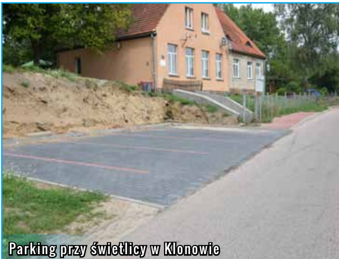
Parking przy świetlicy w Klonowie