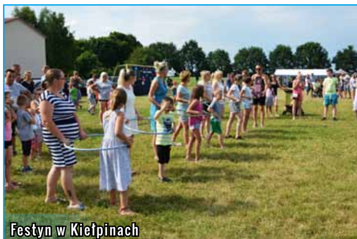
Festyn w Kietpinach