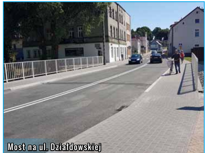
Most na ul. Działdowskiej