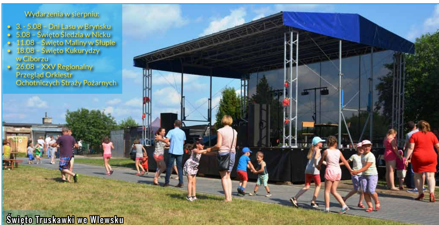
Święto Truskawki we Wlewsku