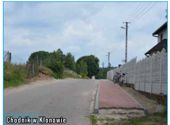
Chodnik w Klonowie