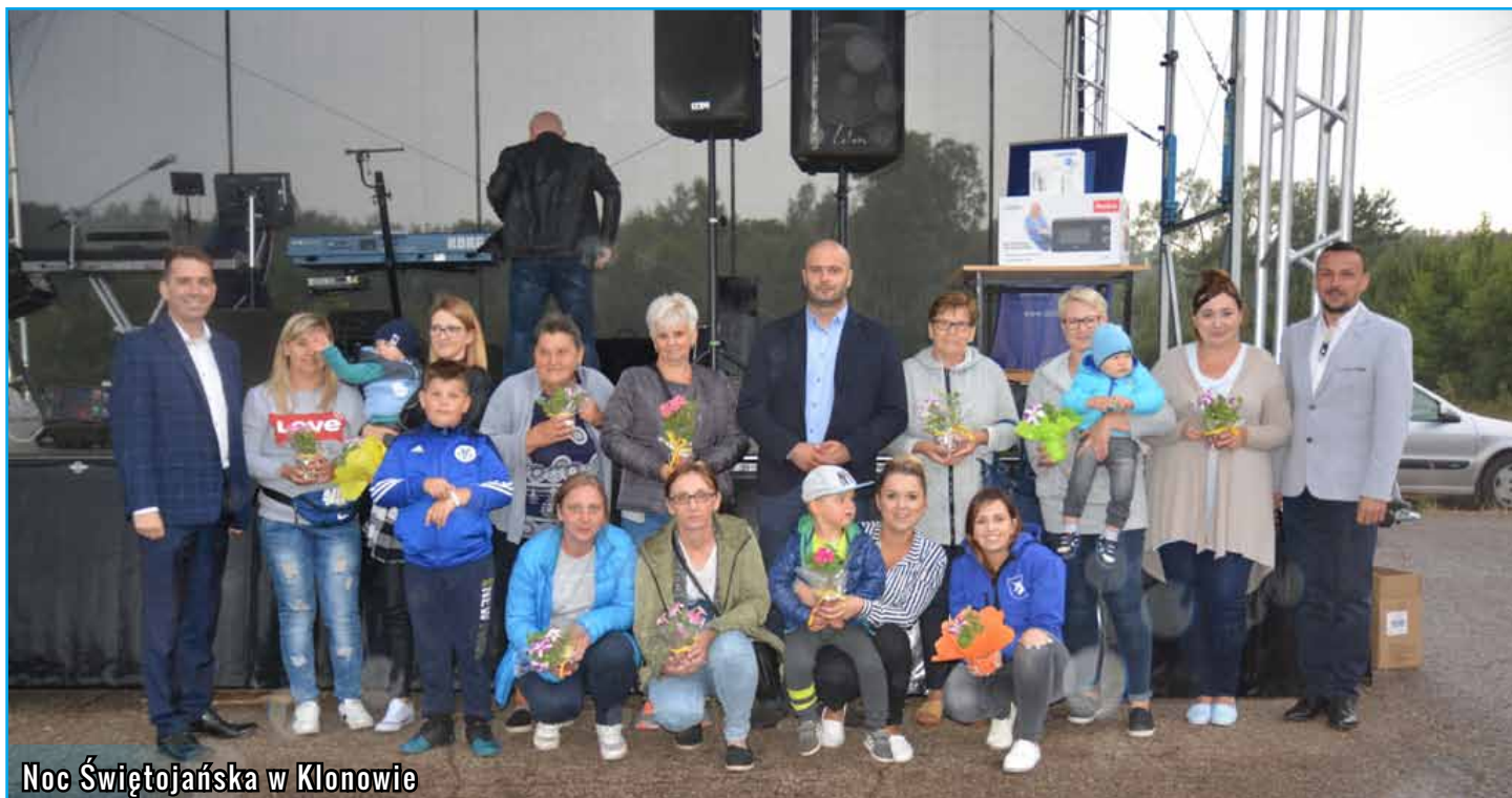
Noc Świętojańska w Klonowie