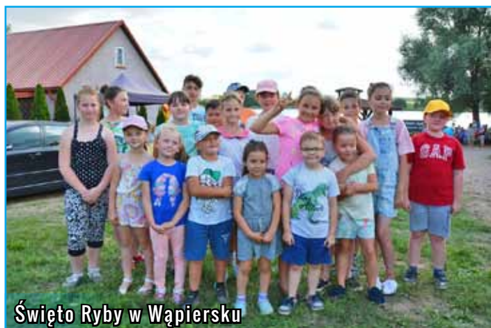
Święto Ryby w Wąpiersku