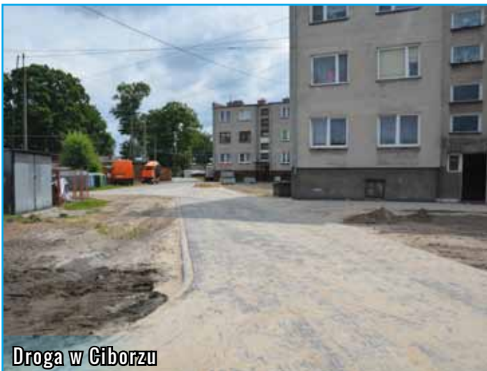
Droga w Ciborzu