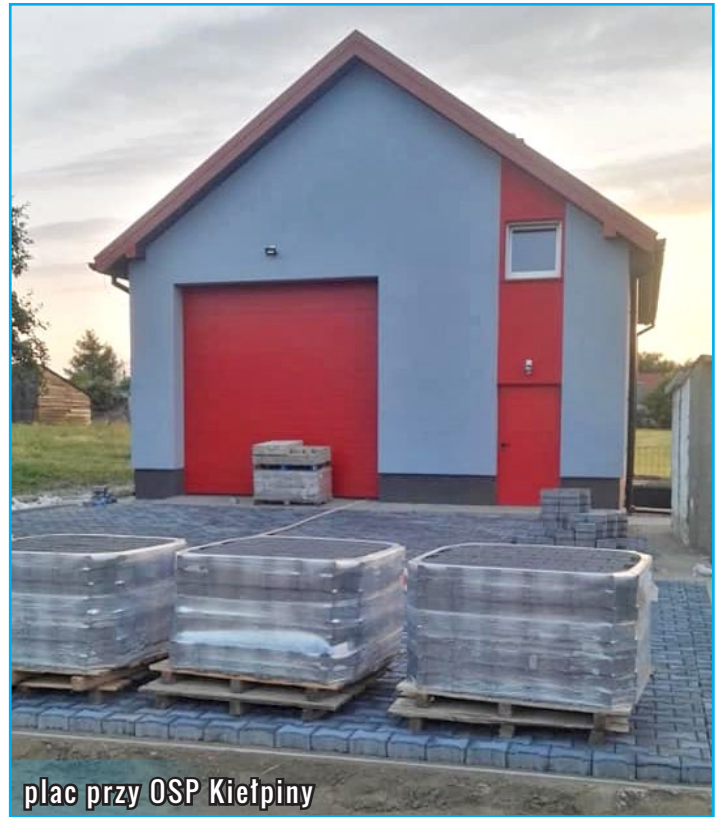
plac przy OSP Kietpiny

Trwa budowa chodnika oraz parkingu przy świetlicy w Klonowie za 120 tys. zł. wykonywana również przez PGK s. z o. o. oraz długo wyczekiwane prace przy przebudowie wjazdu do Przychodni Zdrowia w Dłutowie za 79 950 zł wykonywane przez firmę Kamex. Dobięły końca prace przy zagospodarowaniu terenu przy świetlicy wiejskiej w Nowym Dłutowie za 37 207 zł., a także budowa boiska w Jeleniu. Trwa poprawa efektywności energetycznej budynku Szkoły Podstawowej w Kietpinach, na którą udało się pozyskać dofinansowanie z Regionalnego Programu Operacyjnego w wysokości ponad 926 tys. zł. w ramach remontu wykonana zostanie termomodernizacja budynku – docieplenie ścian, wymiana części okien i drzwi zewnętrznych. Wymieniony zostanie również piec na ten proekologiczny na pellet, a także zamontowane nowe, energooszczędne oświetlenie. Planowany jest remont kolejnej drogi na terenie m. Wlewk. Przetarg nie został rozstrzygnięty. Do przetargu na przebudowę drogi zgłosiło się dwóch oferentów, którzy jednak podali wyższą kwotę niż ta, którą gmina przewidziała na realizację zadania. Najniższą kwotę zaoferowała firma WAPNOPOL – 423 161, 08 zł. W związku z tym planowane jest zwiększenia środków w budżecie, dzięki czemu możliwe będzie wykonanie inwestycji, której zakończenie planowane jest wraz z końcem wakacji. Trwają również prace przy zagospodarowaniu terenu przy garażu dla OSP w Kietpinach.