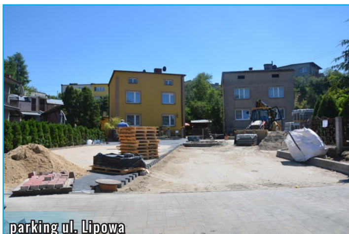
parking ul. Lipowa