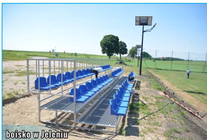
boisko w Jeleniu