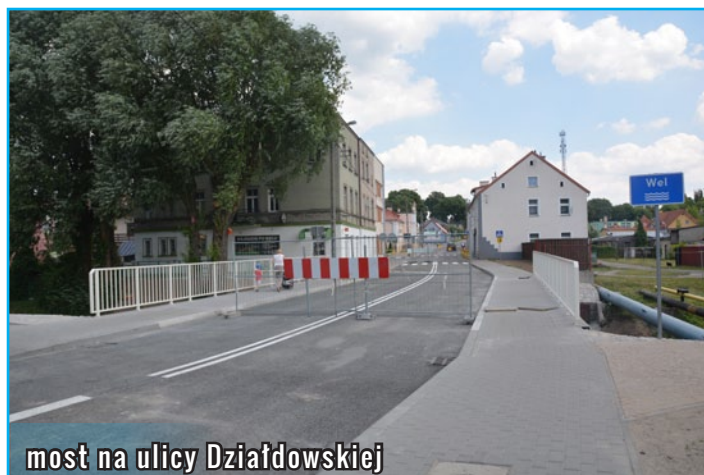
most na ulicy Działdowskiej