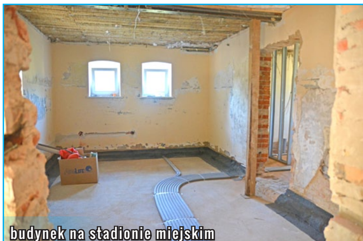
budynek na stadionie miejskim