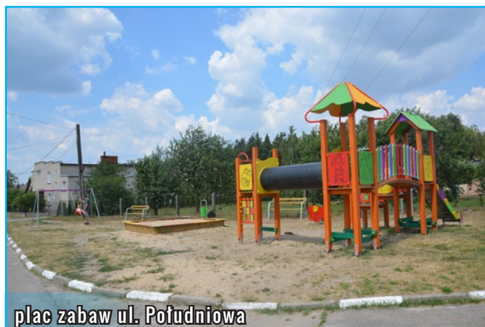
plac zabaw ul. Południowa