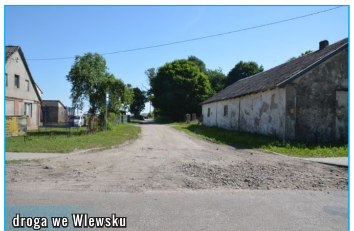
droga we Wlewsku