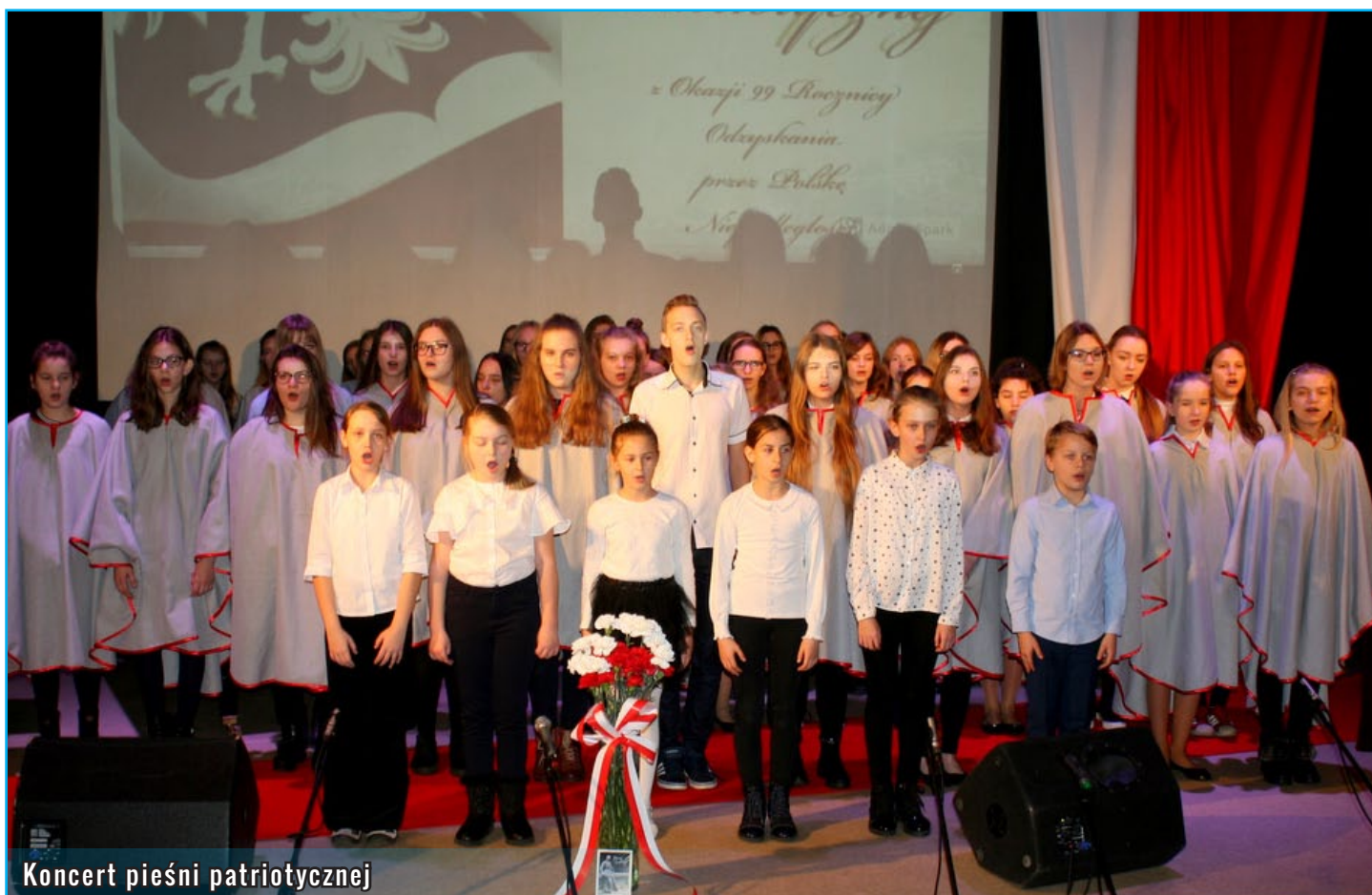
Koncert pieśni patriotycznej