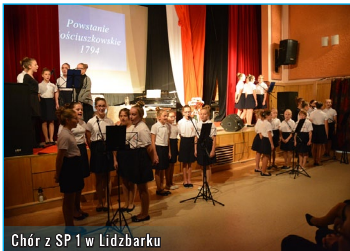
Chór z SP 1 w Lidzbarku