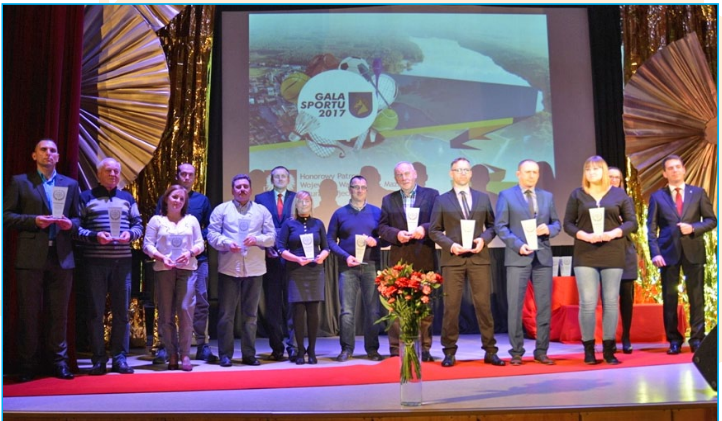
Trenerzy lidzbarskich sekcji sportowych