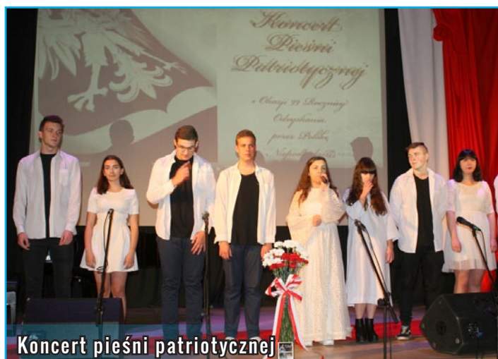
Koncert pieśni patriotycznej