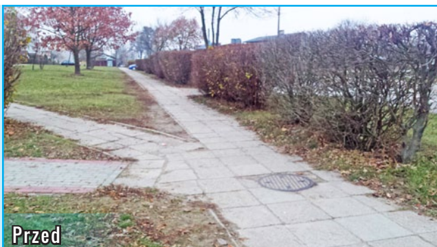
przebudowa chodnika na ulicy Jeleńskiej

W dalszym ciągu trwa realizacja inwestycji przewidzianych w tegorocznym budżecie. Zakończyła się przebudowa chodnika na ul. Jeleńskiej za 120 tys. zł, a także budowa placu przy świetlicy wiejskiej w Jamielniku. Mieszkańcy Jamielnika poza placem przy świetlicy, który sfinansowany został z funduszu sołectkiego, cieszyć się mogą nowym miejscem do spotkań integracyjnych, które powstało przy zbiorniku wodnym. Dobięły końca prace przy budowie drogi w Zdrojku za ok. 196 tys. zł. i Zalesiu za 121 tys. zł., a także przebudowa drogi w Kiełpinach. Wykonany został również chodnik w Dłutowie przy ul. 1000-lecia za niespełna 124 tys. zł., parking na ul. Myśliwskiej oraz chodnik na ul. Południowej. Zakończył się również remont chodnika na ul. Podzamcze. W najbliższym czasie rozpocznie się budowa drogi w Wawrowie w kierunku Marszewnicy za ok. 288 tys. zł i drogi w Podciborzu.