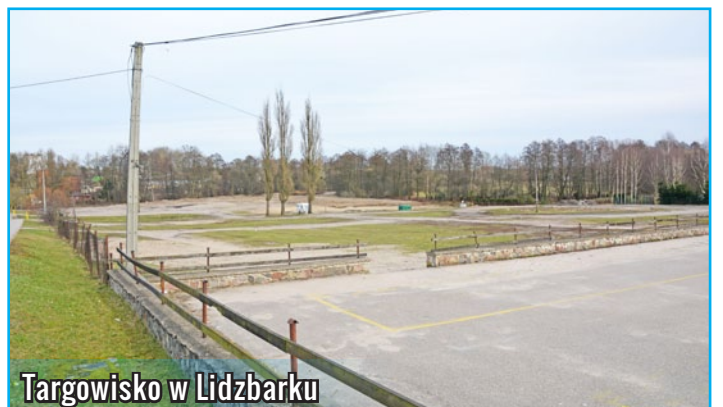
Targowisko w Lidzbarku