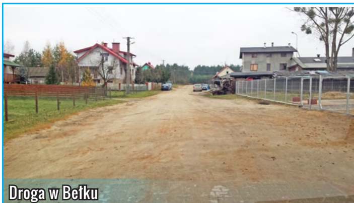
Droga w Bełku