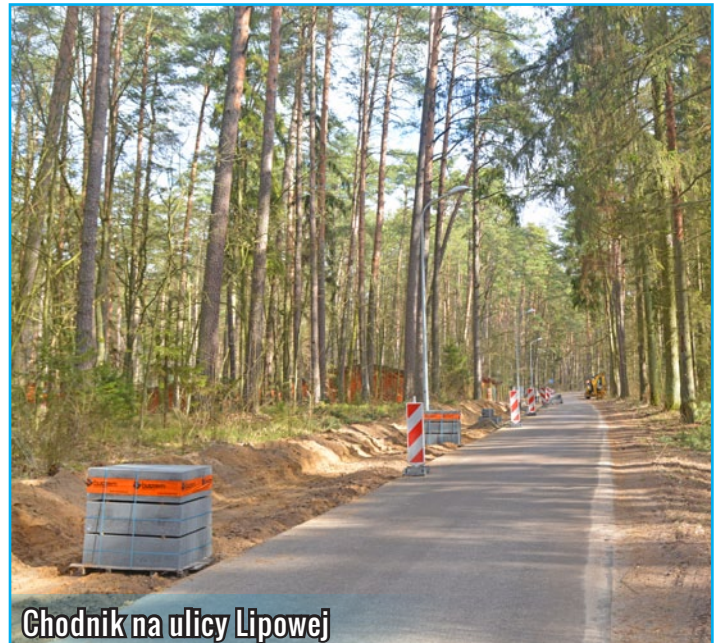
Chodnik na ulicy Lipowej

Na 2017 rok zaplanowane są 43 zadania inwestycyjne, nastawione głównie na przebudowę infrastruktury drogowej, remont i modernizację budynków użyteczności publicznej czy wykonanie dokumentacji, których kwota przekroczy 7 299 000 zł. Ważnym przedsięwzięciem jest przebudowa miejskiego targowiska, a także długo wyczekiwana przez mieszkańców miasta modernizacja parkingu znajdującego się przy cmentarzu w Lidzbarku. Istotnym punktem budżetu są środki pozyskiwane z zewnątrz. Gmina złożyła wniosek o dofinansowanie m. in. budowy ścieżki wokół jeziora, placu zabaw na ul. Jeleńskiej czy modernizacji stadionu miejskiego.