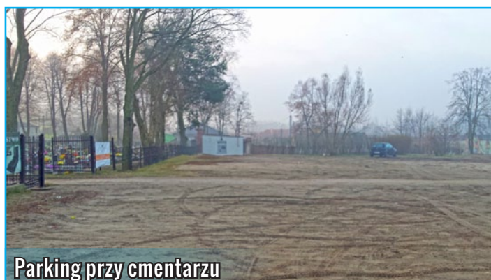
Parking przy cmentarzu