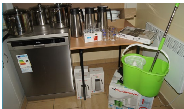
Świetlica wiejska w Zdrojku