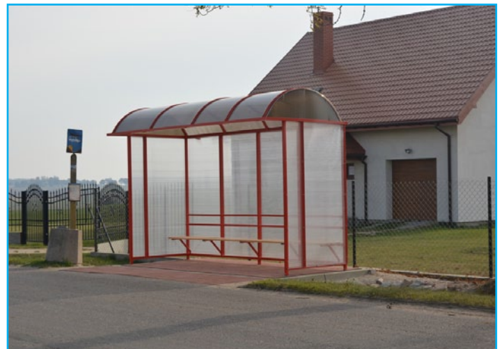
Zakup i przebudowa przystanku autobusowego w Nowým Dłutowie