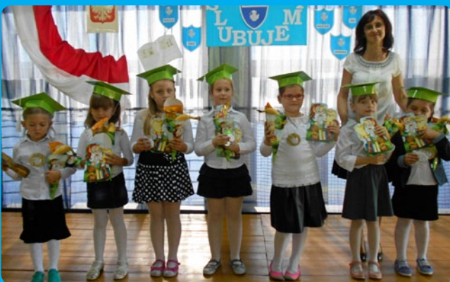
Pierwszaki Szkoły Podstawowej w Kiełpinach składały w dniu 1 października uroczyste ślubowanie.