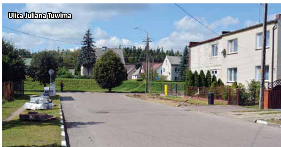
Ulica Juliana Tuwima