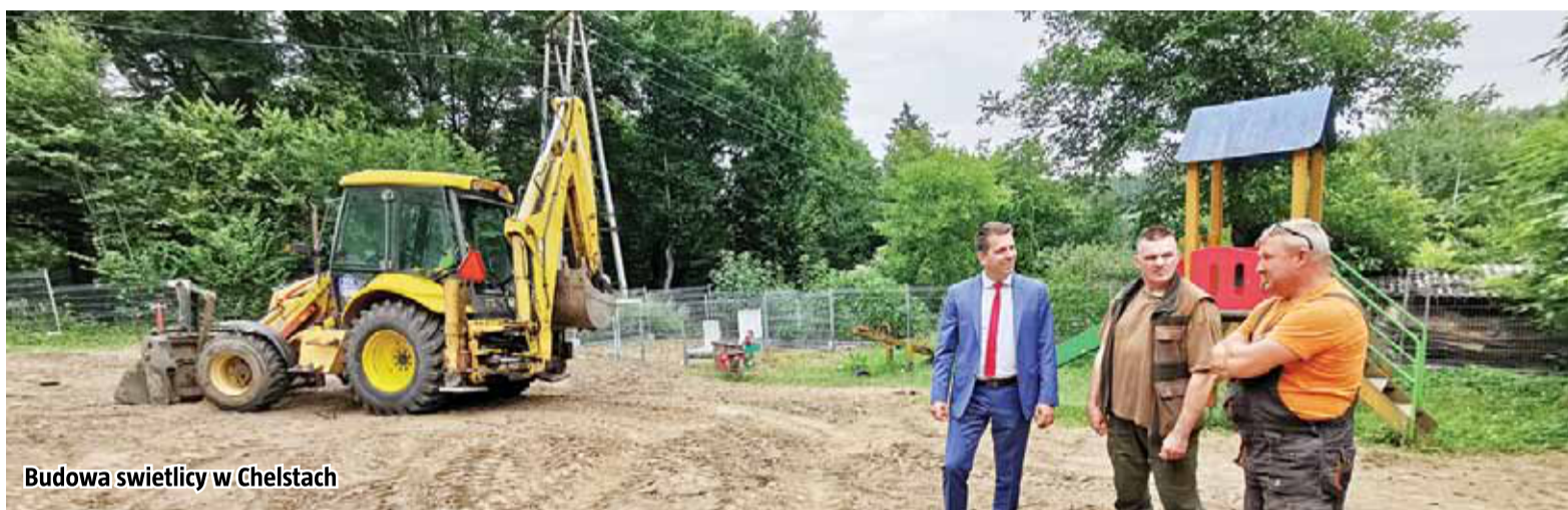
Budowa świetlicy w Chelstach