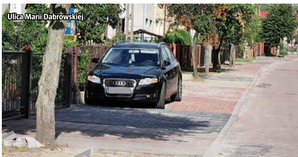
Ulica Marii Dąbrowskiej