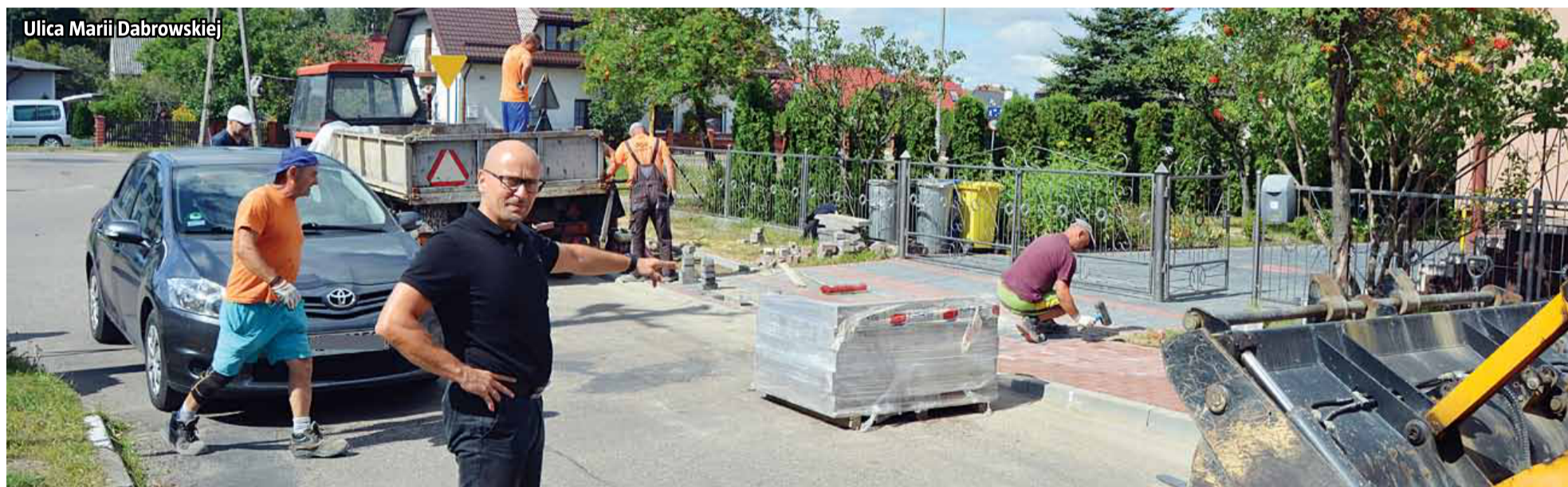
Ulica Marii Dąbrowskiej