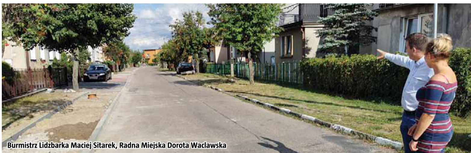
Burmistrz Lidzbarka Maciej Sitarek, Radna Miejska Dorota Waclawska

Prace przy lidzbarskim przed szkole zakończono. Dzięki inwestycji powstało 14 dodatkowych miejsc parkingowych. Ta wiadomość z pewnością ucieszy rodziców, którzy co rano podwożą dzieci pod lidzbarskie przedszkole. Parking powstał na terenie o pow. około 230 m 2 . Dodatkowo wybudowana została droga dojazdowa oraz chodnik. Całkowity koszt inwestycji to prawie 186 tys. zł. Trwają natomiast prace przy budowie chodnika na ul. Tuwima/ Dąbrowskiej za 115 620 zł. W kolejnych latach planowane są budowy kolejnych chodników na terenie naszej gminy. Rozpoczęła się także budowa świetlicy w Chelstach w miejscu byłej hydroforni. W trakcie budowy jest również boisko w Nicku i w Jeleniu.