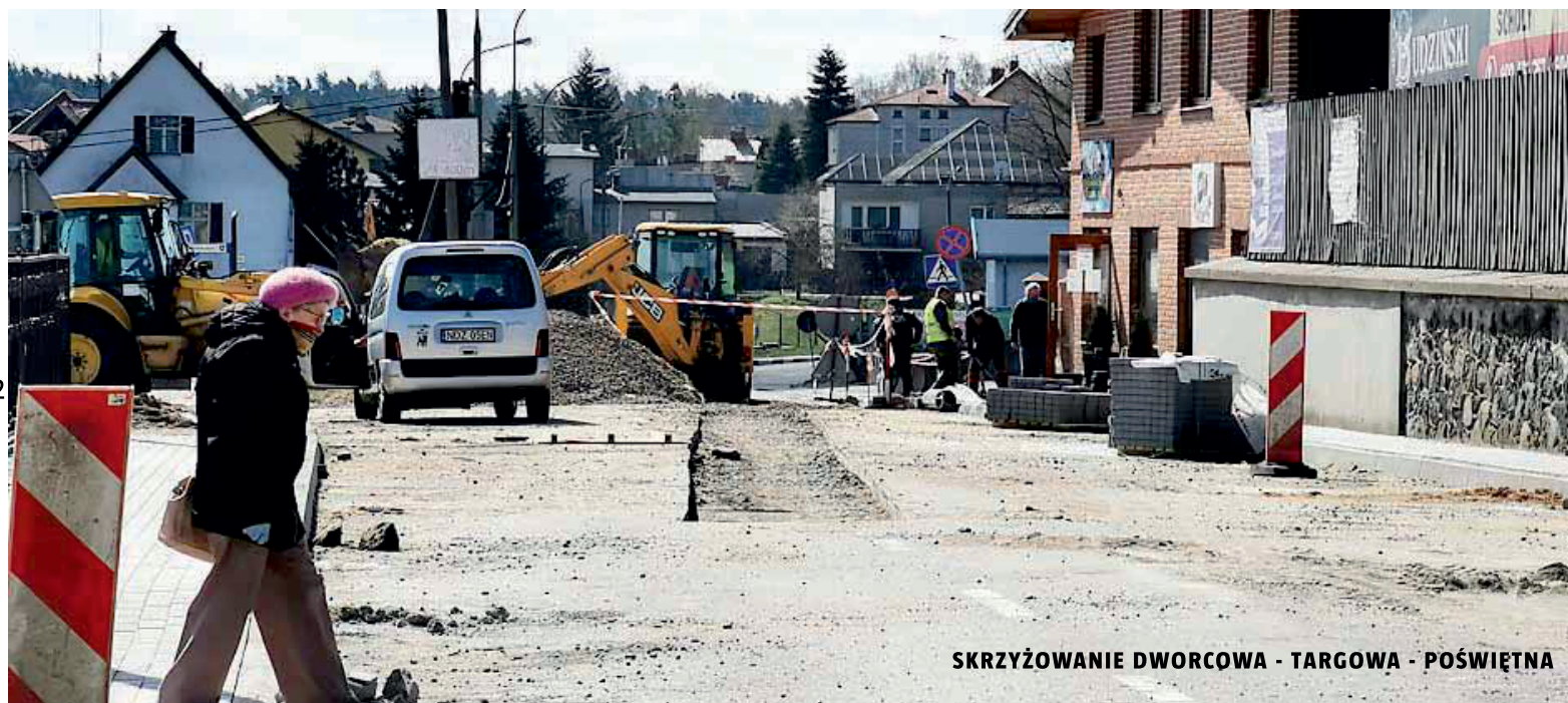
SKRZYŻOWANIE DWORCOWA - TARGOWA - POŚWIĘTNA

W ostatnim czasie powstał również chodnik na ul. Wia