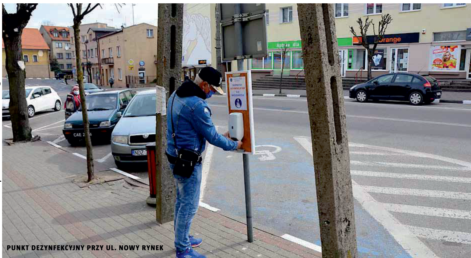
PUNKT DEZYNFEKCYJNY PRZY UL. NOWY RYNEK